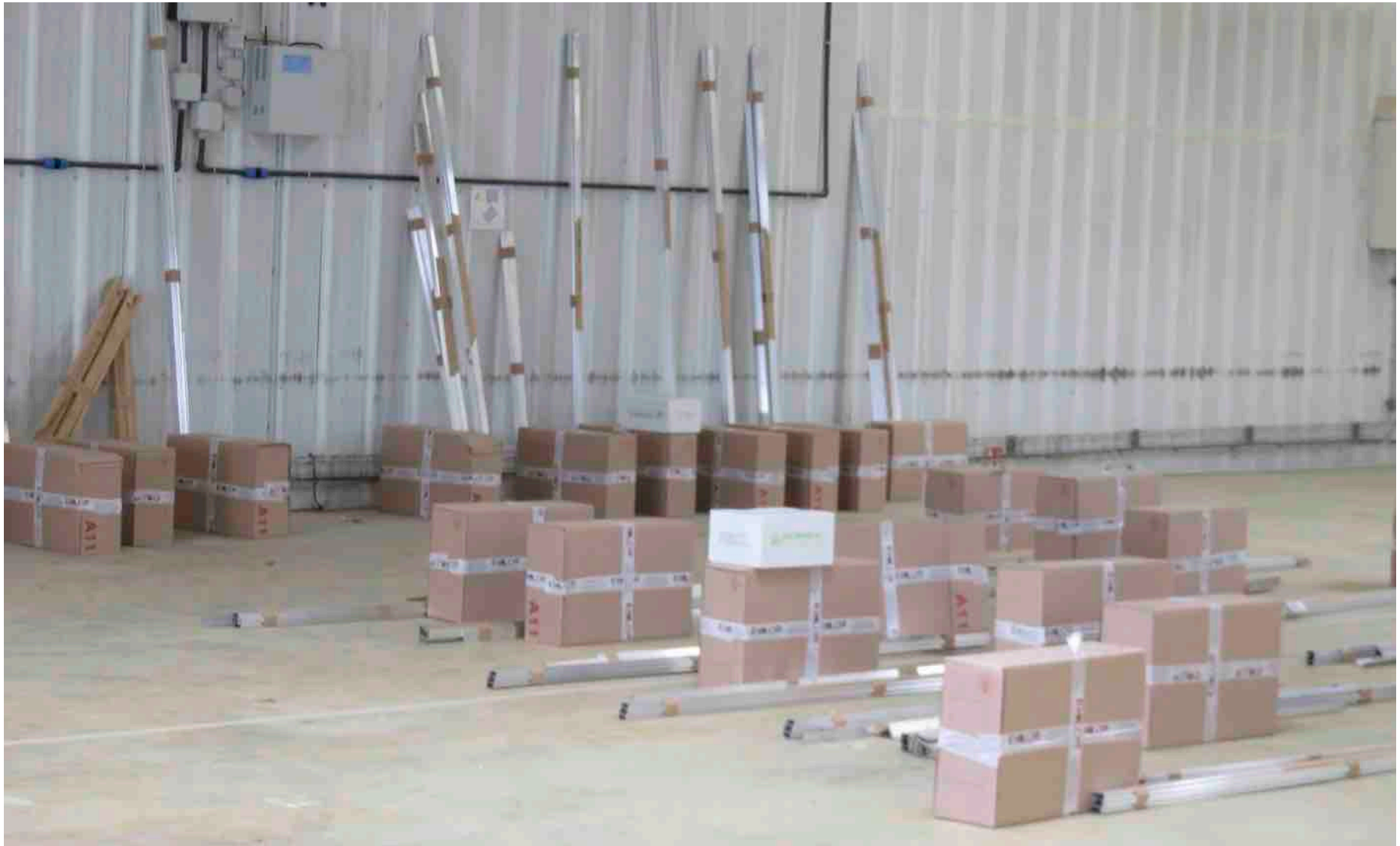
cartons individuels et rails