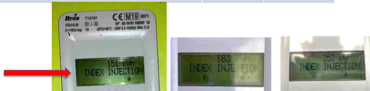
kit alu mural 2 panneaux 750 Wc, Combrit